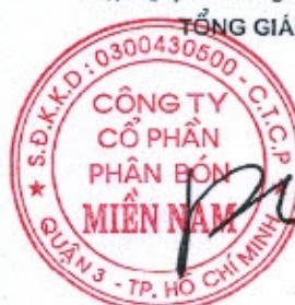
PHÙNG QUANG HIỆP